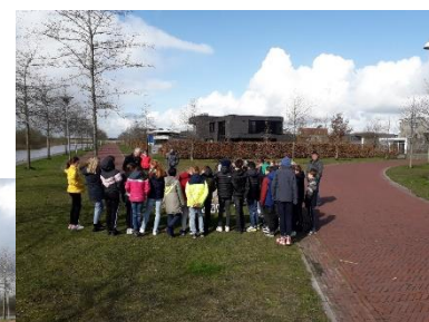
Een leerzame ontmoeting!